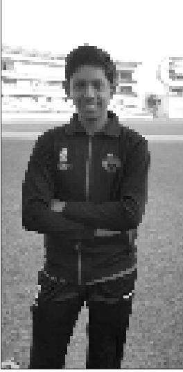
ચિ. પુરવ પરીખ